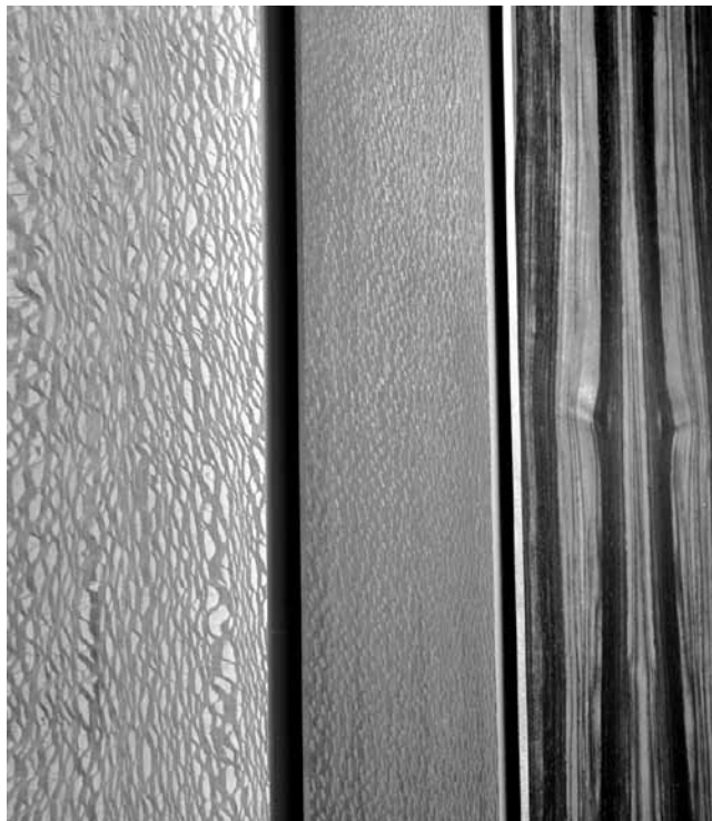
Fast unnatürlich wirken manche Holzarten, wenn man sie im richtigen Winkel bearbeitet.